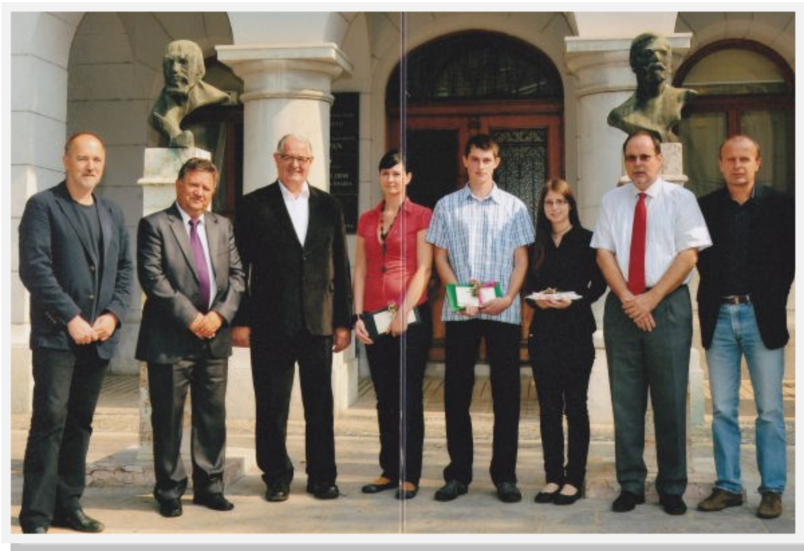
Svečano srečanje z županom Novega mesta.